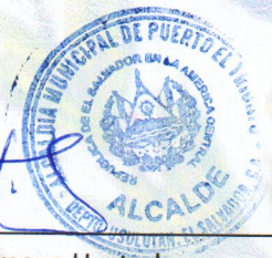
Cap. Edgar Javier Amaya Hurtado Alcalde Municipal